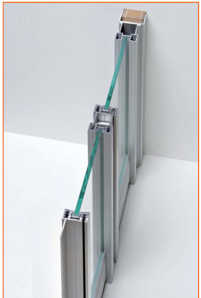
Abb. 2 Modellansicht der Trennwand mit Wandanschluß (Schnitt)

Der Deckenanschluß erfolgt wie bei Gleittüren über das Deckenprofil. Am Boden werden die Festelemente entweder mit der üblichen Bodenschiene und Rollen gefertigt und dann abgestoppt, oder auf eine mitgelieferte Befestigungsleiste gestellt und fixiert.