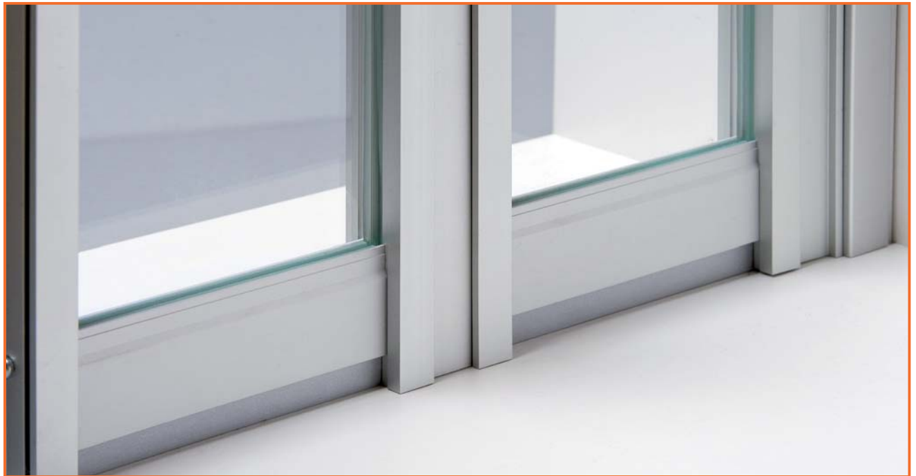
Abb. 3 Modellansicht Bodenanschluß mit Befestigungsleiste

Das division Trennwandsystem wird durch eine Vielzahl an ergänzenden Bauteilen komplettiert. Flexible Wandanschlüsse erleichtern die Montage. Gleittüren lassen sich als Durchgangstüren in die Wand integrieren. Selbstverständlich gibt es für die Türen stabile Stoßgriffe. Für Drehtüren haben wir ein stabiles Türzargenprofil entwickelt. Für erhöhte Anforderungen an den Schallschutz bieten wir Ihnen Schallschutz Verbundsicherheitsgläser in Verbindung mit einem abgedichteten Deckenanschluß.